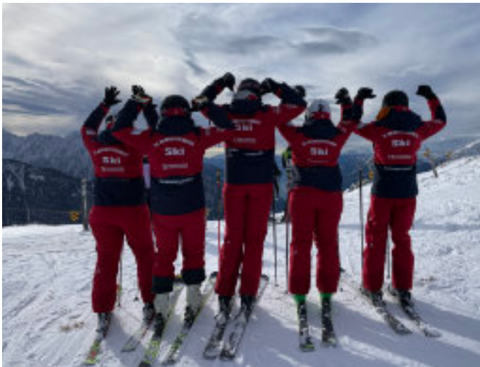
Skilehrer und -lehrinnen des SCO

In der Wintersaison 2025/2026 lädt die Skiabteilung des SC Oberweikertshofen wieder alle Ski- und Snowboardbegeisterten zu abwechslungsreichen Fahrten in die Alpen ein. Ob Anfänger, Fortgeschrittener oder einfach Genussfahrer – für jede*n ist etwas dabei!