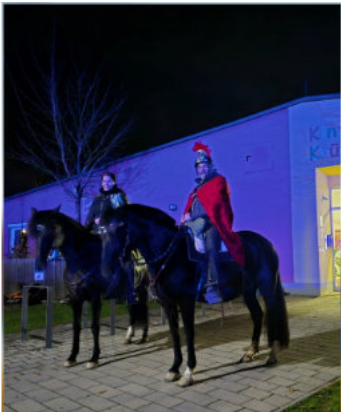
St. Martin 2025

Am Dienstagabend, 11. November, zog ein langer, wunderschöner, beleuchteter Laternenzug über das AWO Seniorenzentrum, vorbei an der Feuerwehr und dem Bürgerhaus, über die Dachauer Straße. Dort trennten sich die beiden Gruppen, denn jede feierte bis in die Abendstunden in seinem eigenen Garten bzw. auf dem Parkplatz - bei Punsch, Glühwein und leckerem Essen - das Teilen und das Miteinander und dachten dabei an den lieben St. Martin.