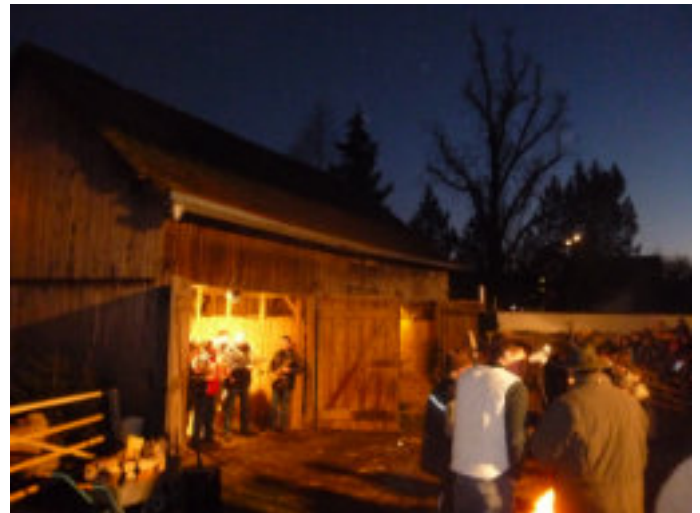
Lebende Krippe 2024

Die Freiwillige Feuerwehr Unterschweinbach lädt am 4. Adventssonntag, den 21. Dezember ab 14.00 Uhr zur Lebenden Krippe auf dem Dorfplatz in Unterschweinbach ein.