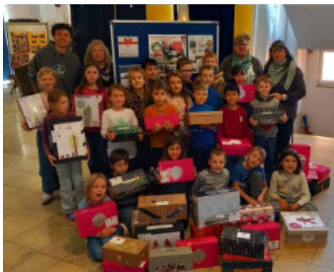
Kinder mit Päckchen

Zuerst wurden Schuhkartons in Geschenkpapier verpackt oder mit selbst gemalten Bildern verziert. Danach wurden sie von den Kindern ganz aufgeregt mit Sachspenden gefüllt und danach fest verschlossen. Es kamen somit 30 Päckchen für bedürftige Kinder im Alter von drei bis 15 Jahren zusammen.