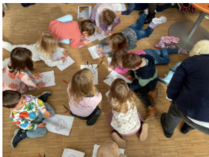
Kinder und Senioren beim Malen

Zum Abschluss durfte jeder noch ein Bild von einem Apfelkorb bunt anmalen.