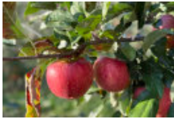
Äpfel am Baum