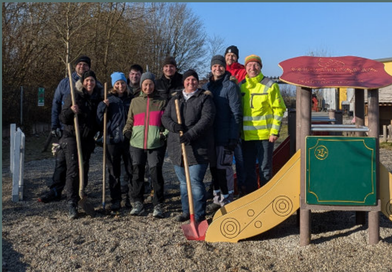
Freiwillige Helfer: Eltern der Kinder der Großen Kümelkiste in Egenhofen verteilen den Fallschutz aus Kies. Vielen Dank an alle!