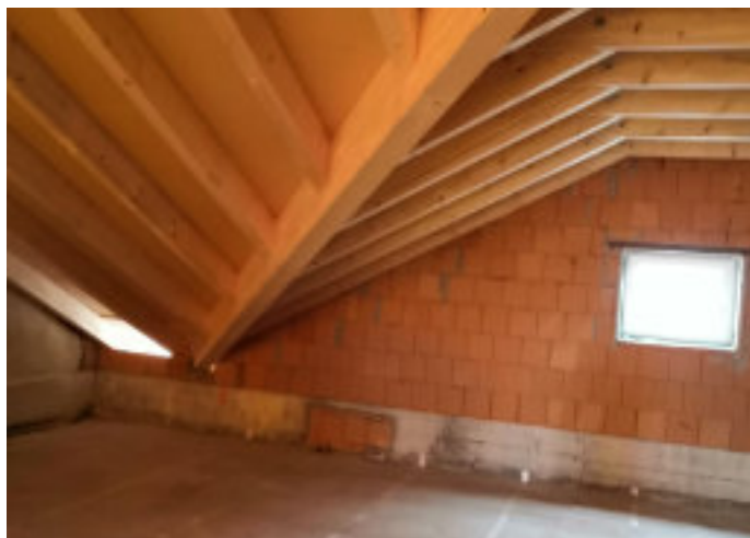
Dachstuhl Mehrzweckhalle Aufkirchen