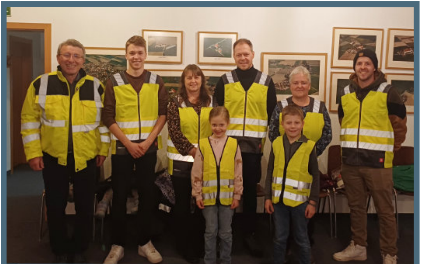
Gratulation an die Gewinner der Verlosung der Warnwesten aus der Novemberausgabe des Mitteilungsblatts. Sie alle konnten das Gründungsjahr der Gesamtgemeinde - 1978 - richtig nennen.