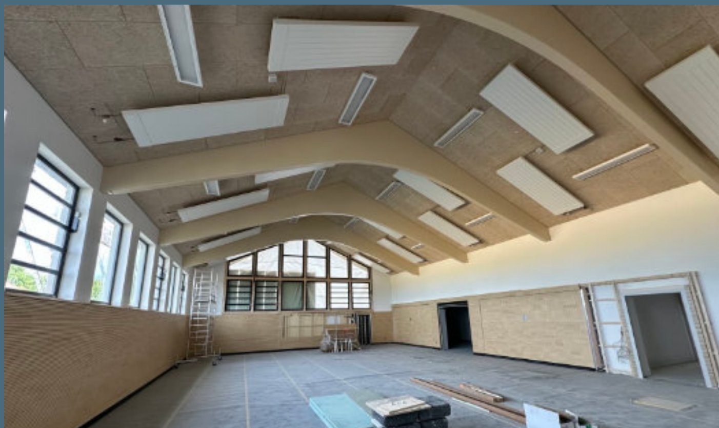
Mehrzweckhalle Aufkirchen - Die Halle ist bereits von der Grundschule sowie den Vereinen in Betrieb genommen.