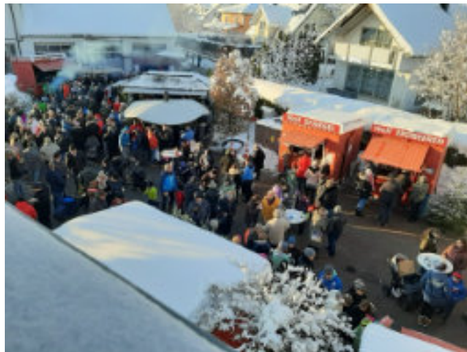
Adventsmarkt Egenhofen 2024

Der Feuerwehrverein Egenhofen e.V. und die Freiwillige Feuerwehr Egenhofen laden alle Bürgerinnen und Bürger der Gemeinde Egenhofen am 1. Adventssonntag, den 30. November 2025 zu ihrem traditionellen Christkindl- und Hobbykünstlermarkt in Egenhofen ein.