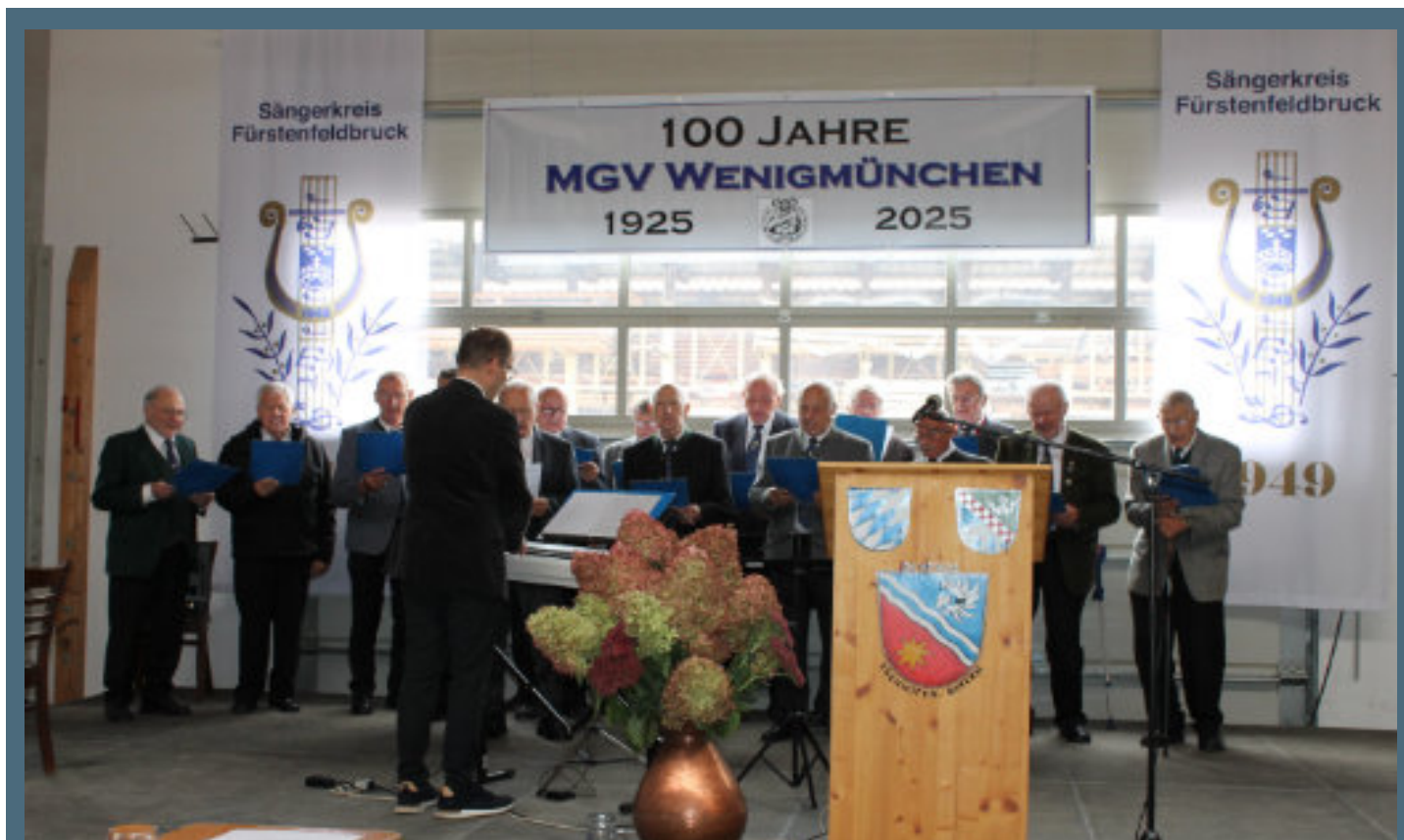
Feierlichkeit 100 Jahre Männergesangsverein Wenigmünchen