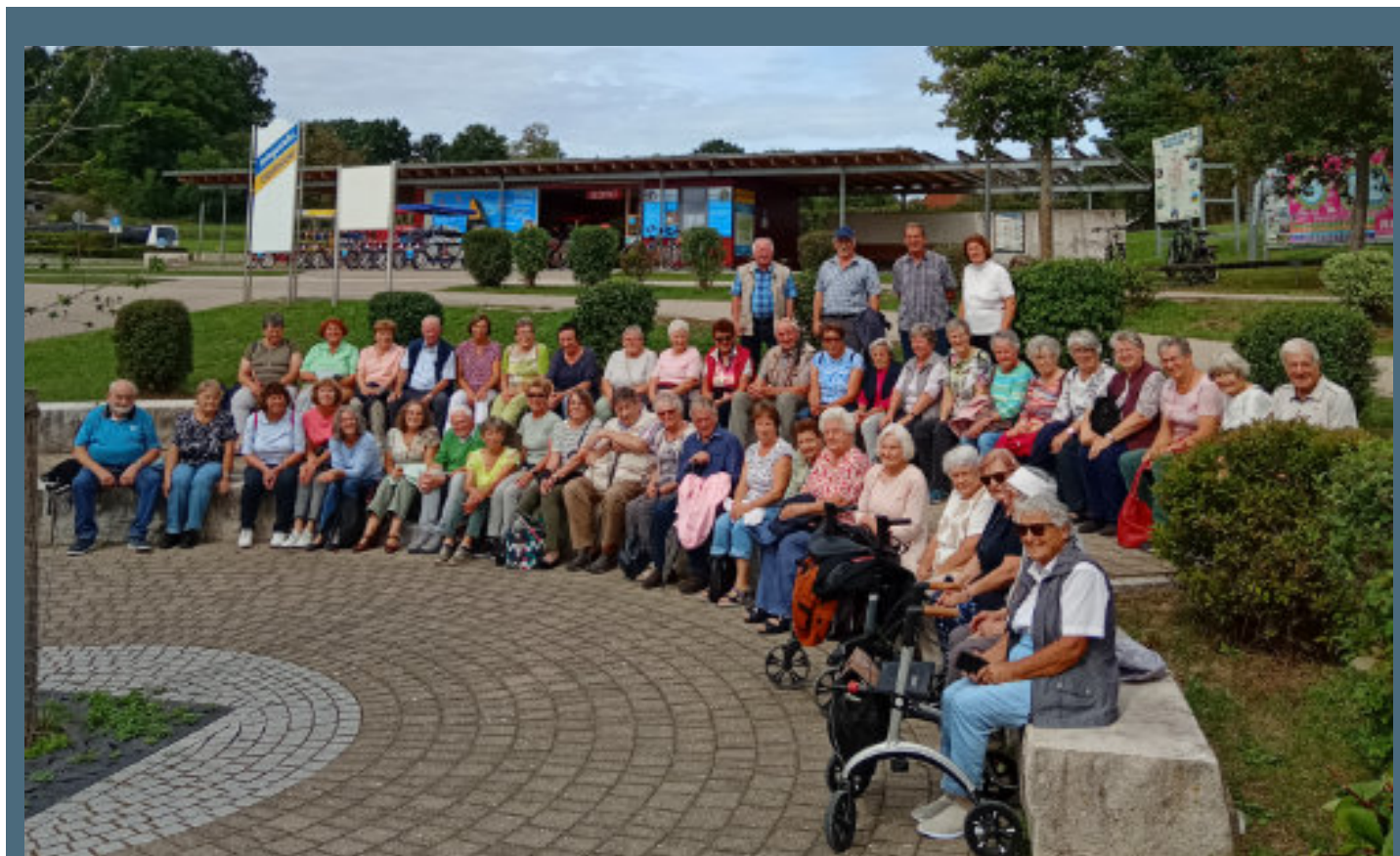
Teilnehmer und Teilnehmerinnen des Seniorenausfluges der Gemeinde Egenhofen an den Brombachsee im September 2025