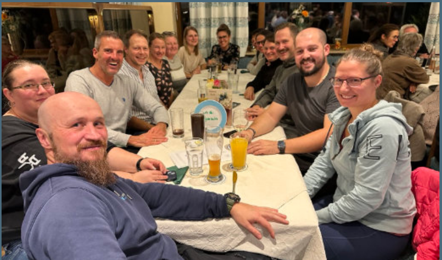
Dankeschön-Essen der Verkehrswacht FFB: Schulweghelfer und -helferinnen aus der Gemeinde unter 170 Kolleginnen und Kollegen aus dem gesamten Landkreis