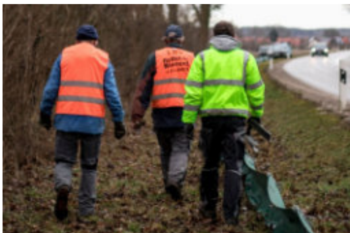
Ehrenamtlicher Aufbau eines Amphibienschutzzaunes

Der warme Februar verheißt einen frühen Start in die Amphibiensaison: Kröten, Frösche und Molche machen sich aktuell auch im Landkreis Fürstfeldbruck auf den Weg zu ihren Laichgewässern.