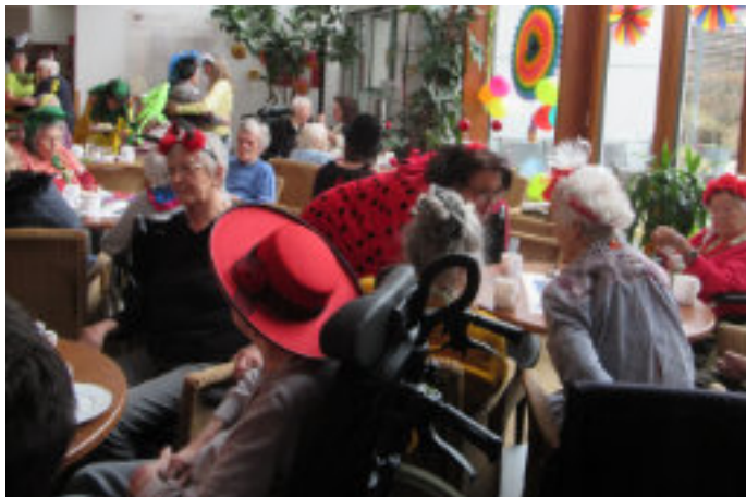
Fasching im AWO-Seniorenzentrum

Zünftig ging es zu am Mittwoch, den 07.02.2024 im Seniorenzentrum Egenhofen: die Bewohnerinnen und Bewohner des Seniorenzentrums Egenhofen feierten gemeinsam mit Angehörigen, Ehrenamtlichen und Mitarbeiter:innen Fasching.