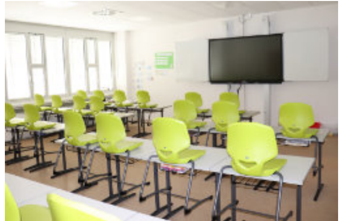
Sanierte Räume in der Mittelschule Maisach

Am 25. März wurden die elf modernisierten Räume zur Nutzung an die Realschule übergeben. „So schön ist es geworden!“ – Realschulleiterin Lux zeigt sich begeistert von den lichtdurchfluteten, technisch bestens ausgestatteten Räumen. Zudem lobt sie die verbesserte Akustik, die sich auf die neuen Rasterdecken zurückführen lässt. Erneuert wurden auch die Elektroinstallation und die Medientechnik, die Wände erhielten einen frischen Anstrich. Die Lüftungszentrale auf dem Dach der Schule wird die sanierten Klassenzimmer in Kürze mit Frischluft versorgen.