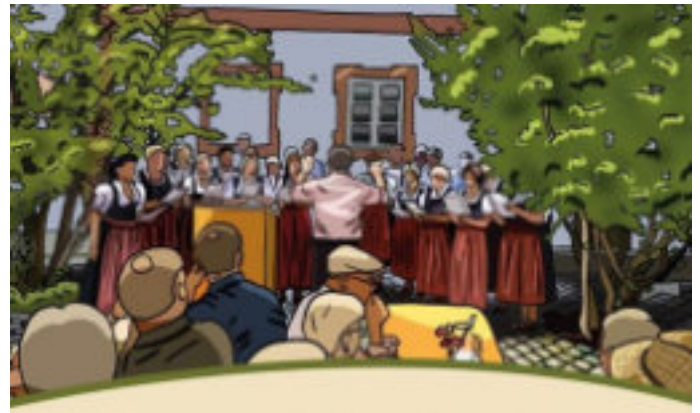
Konzert des Liederkranzes Aufkirchen

Der Liederkranz Aufkirchen lädt am Samstag, den 20. Juni 2026 zu seinem Sommerkonzert unter dem Motto „Lieblingslieder“ in den Pfarrhof Aufkirchen ein.