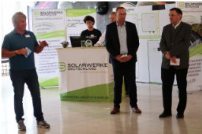
Eröffnung der Energiemesse Maisach

Am 8. und 9. Mai 2026 fand in Maisach die Energiemesse 2026 statt. Die Gemeinden Maisach und Egenhofen bedankten sich bei den Ausstellern und Vortragenden für ihren Einsatz und die gute Zusammenarbeit an den beiden Messtagen.