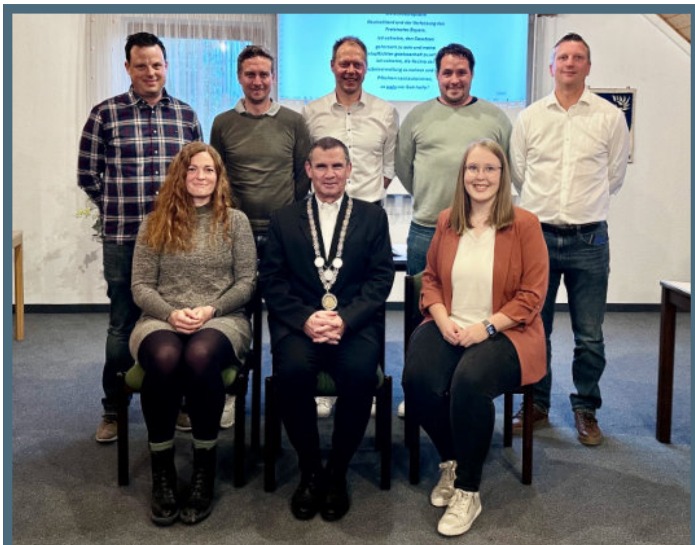
Die neuen Gemeinderatsmitglieder und der neue Bürgermeister wurden in der Konstituierenden Sitzung am Montag, den 1. Mai 2026 im Rathaus vereidigt.