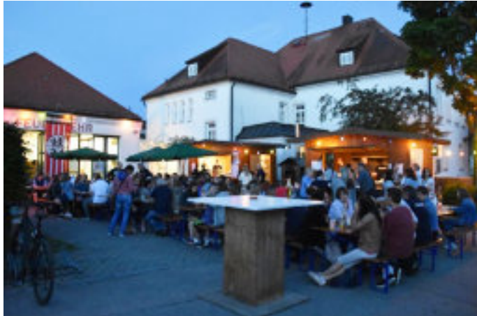
Dorffest in Egenhofen

Die Feuerwehr und der Feuerwehrverein Egenhofen laden recht am Sonntag, den 05. Juli 2026 ab 11.00 Uhr herzlich alle Bürgerinnen und Bürger der Gemeinde Egenhofen zu unserem Dorffest beim Bürgerhaus Egenhofen ein.