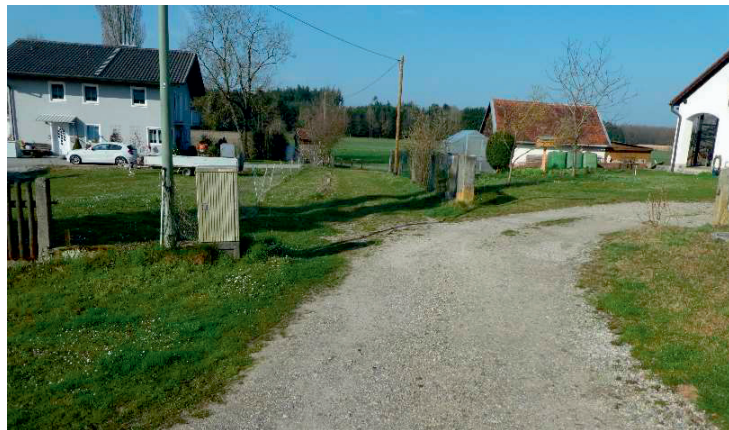
Am Anger, Oberweikertshofen

Die Straße „Am Anger“ im Oberweikertshofen ist gewidmet aber noch nicht vollständig erstmalig hergestellt. Die Anwohner wurden in einer Infoveranstaltung vorab informiert. Der Gemeinderat beschließt die Straße „Am Anger“ in Oberweikertshofen noch in diesem Jahr auszubauen.