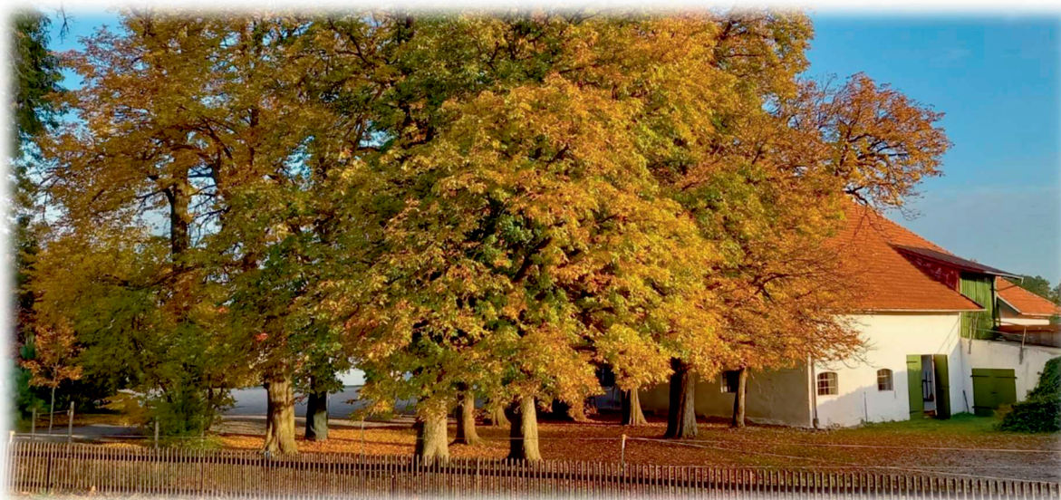
Impressionen aus der Gemeinde

Rathaus und Bauhof sind am Dienstag, den 12. Oktober 2021 für den Parteiverkehr geschlossen bzw. gantzätig nicht erreichbar. Bitte beachten.