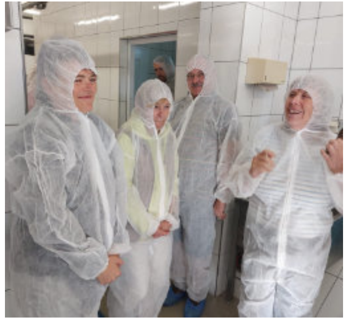
Teilnehmer der Hofladen-Radtour in der Hofmetzgerei Plabst

einem Rundkurs durch die Gemeinde Egenhofen . Es wurden die Hofmetzgerei Plabst in Unterschweimbach, der Backverein Egenhofen, der Geflügelhof Heitmeier in Kuchenried und die Gärtnerei Klement in Unterschweimbach besucht. Überall gab es sehr interessante Informationen und natürlich überaus lecker Kostproben.