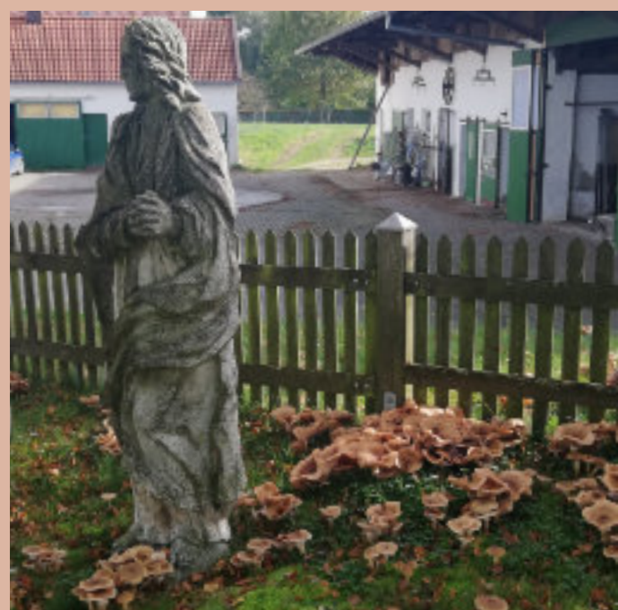
Am Kalvarienberg Wenigmünchen wachsen in diesem Herbst besonders viele Schwammerl.