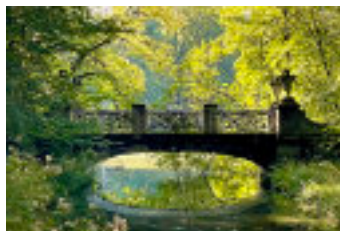
Brücken schlagen zu den Angehörigen