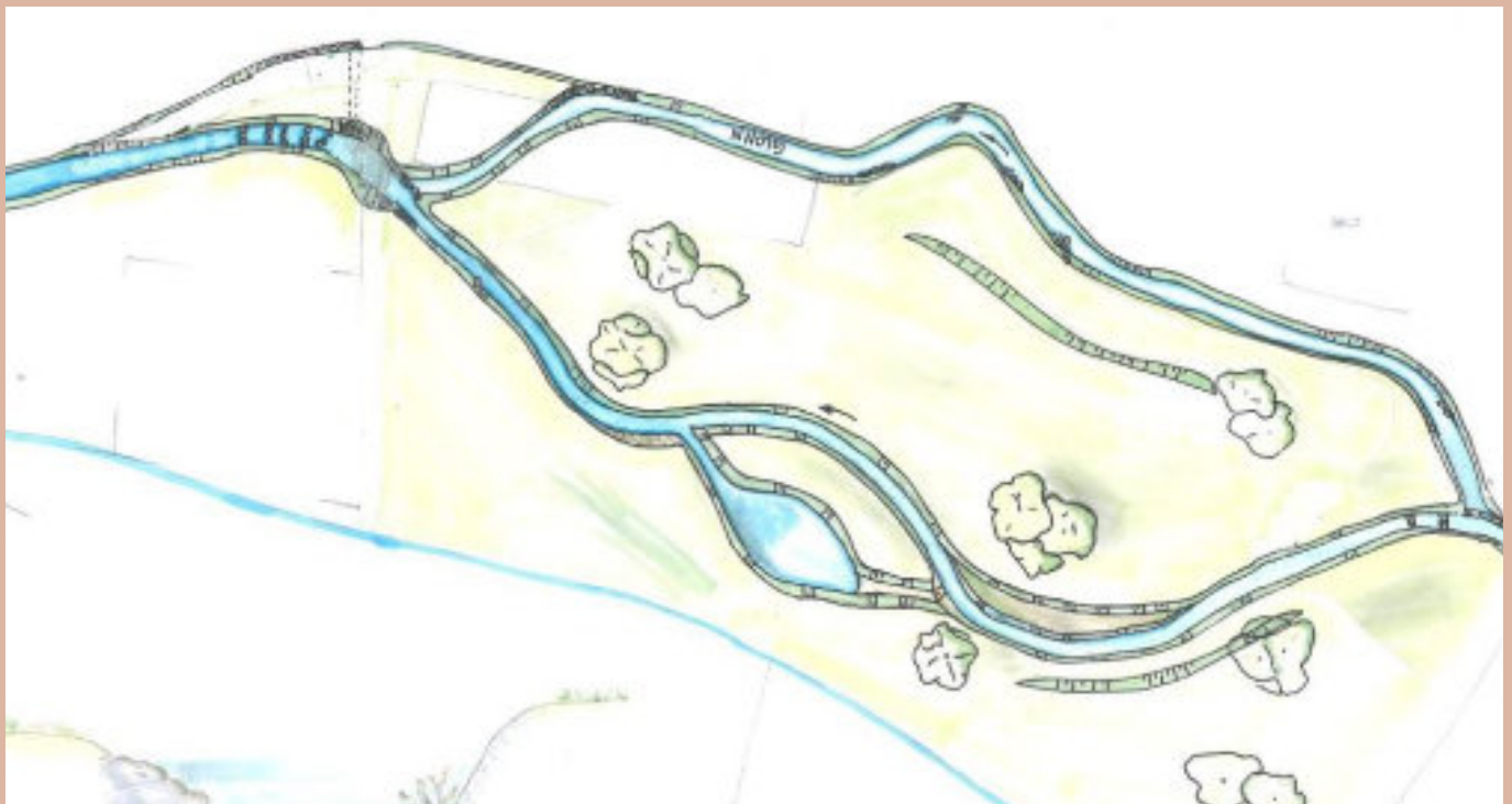
Glonn bei Egenhofen (Darstellung: Werner Consult)

Die Arbeiten zur Verlegung der Glonn in Egenhofen starten im November.