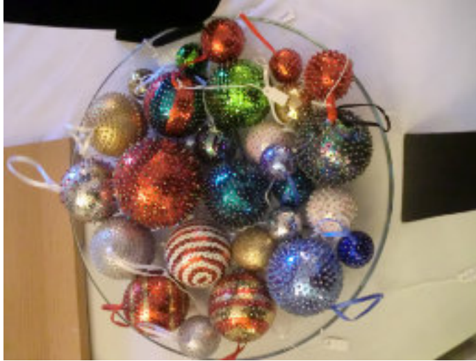
Weihnachtsdekoration bei den Glückspilzen Aufkirchen

Die Kinder und Mitarbeiterinnen der Mittagsbetreuung der Grundschule, die 'Aufkirchner Glückspilze', sind schon in weihnachtlicher Stimmung und basteln schon fleißig für ihren eigenen Adventsmarkt.